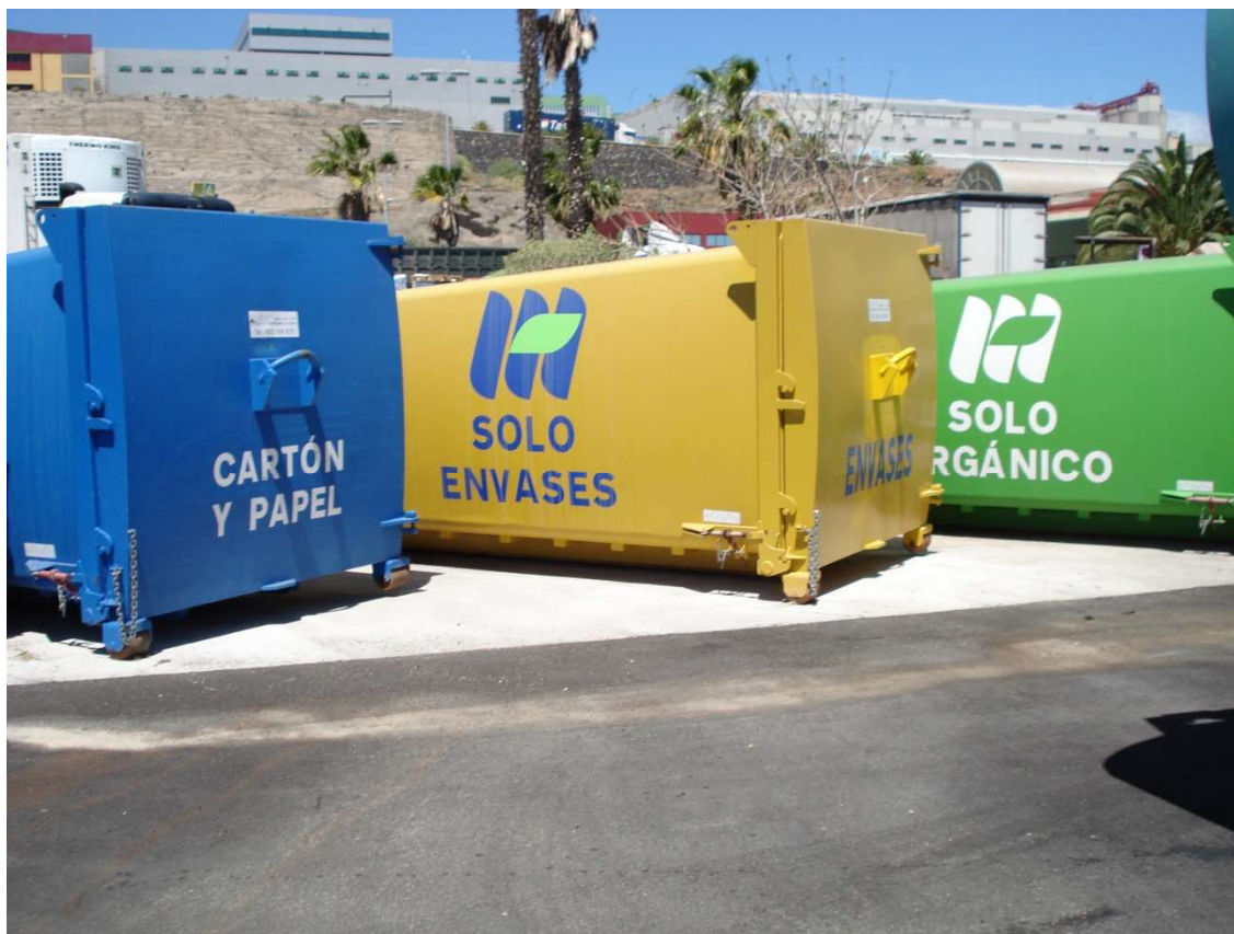
Punto limpio con compactadores y bandejas de recogida selectiva

También se dotó a este espacio de un punto para lavado de los contenedores que usan los mayoristas en el transporte de sus residuos, así como la ubicación de puntos de recogida para residuos tóxicos y peligrosos.