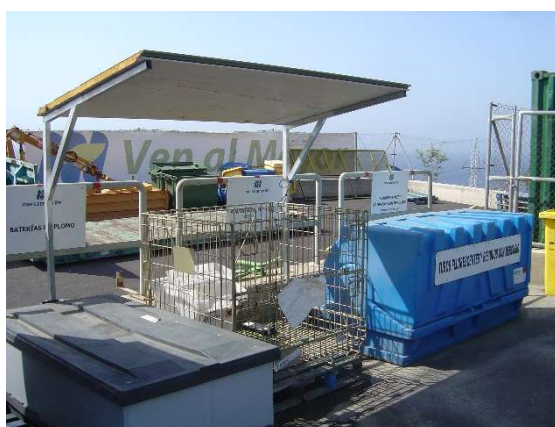
Zona de acopio de residuos tóxicos y peligrosos