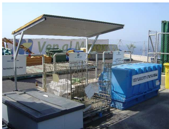
Zona de acopio de residuos tóxicos y peligrosos