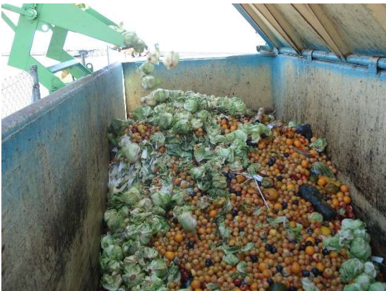
Vertido de residuos orgánicos