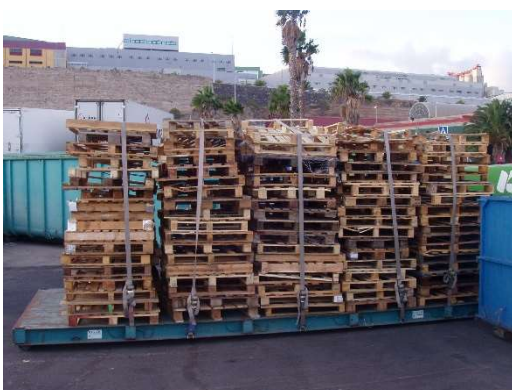
Acopio de residuos de madera.

Además de la mejora ambiental, se ha logrado mejorar el aspecto y las condiciones sanitarias del mercado, ya que se eliminaron todas las zonas de acopio de residuos dispuestas alrededor de las naves donde se producía el movimiento de mercancías.