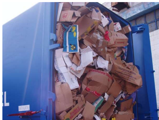
Compactador de cartón

Por otro lado se ha buscado proporcionar un adecuado destino al residuo, ya que no sólo se trabaja en optimizar la separación selectiva de éstos, sino que también, se ha dedicado