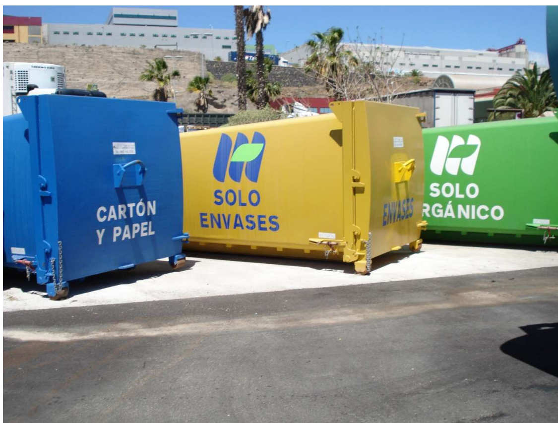
Punto limpio con compactadores y bandejas de recogida selectiva

También se dotó a este espacio de un punto para lavado de los contenedores que usan los mayoristas en el transporte de sus residuos, así como la ubicación de puntos de recogida para residuos tóxicos y peligrosos.