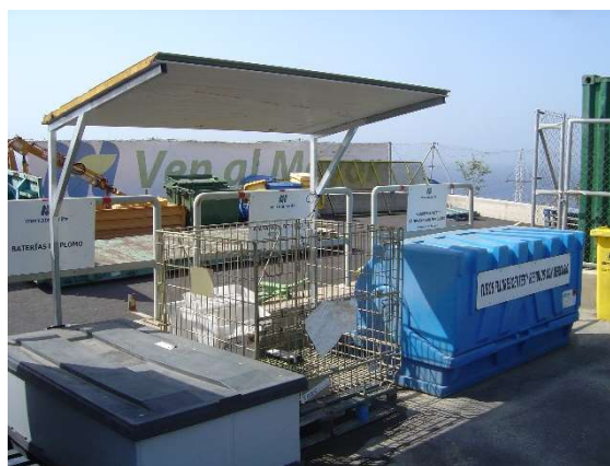
Zona de acopio de residuos tóxicos y peligrosos